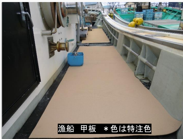
漁船 甲板 *色は特注色