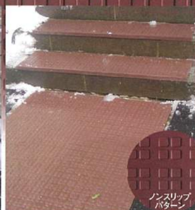
ノンスリップ パターン

ソーヒーターは 玄関先や階段に敷いて コンセントに差込むだけ。 降り出した雪を すばやく融かします。