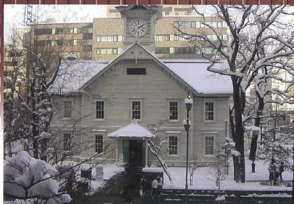
札幌市時計台出入口に敷設